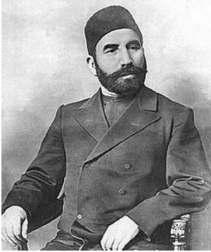
Hacı Zeynalabdin Tağıyev (1823-1924)