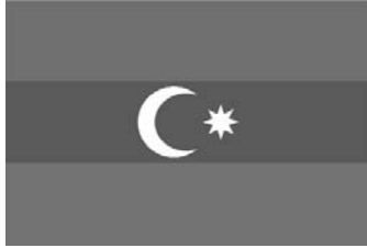
Azərbaycan Respublikasının Dövlət bayrağı