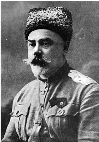
Anton İvanoviç Denikin (1872-1947)