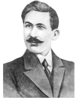
Abbas Səhhət (1874-1918)

- Gənclərə, həmçinin hamıya sözü müasirimiz vətənpərvər yazığımız, şairimiz Abbas Səhhətın məşhur sözləri ilə demək istəyirəm. O deyir: “Bir xalqı çökdürmək üçün onu silahla, topla - tüfənglə qırmağa ehtiyac yoxdur. Daha rahat yol var - Savadsızlıq. Bütün addımlar cəmiyyətin savadsız olması üçün atılarsa, təhsil pula çevrilərsə, savadsızlıq çoxalar, mütaliə