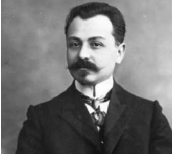
Fətəli xan İskəndər xan oğlu Xoyski (1875-1920)

1920-ci il aprelin 15-də F. X. Xoyski Q. Çiçerinə sonuncu notasında göstərirdi “. . . Azərbaycanın sərhədləri yaxınlığında Dərbənd qəzasında Rusiya sovet hökumətinin xeyli hərbi qüvvələrinin cəmləşməsi müşahidə olunur. Sovet hökumətinin niyyətlərindən xəbərsiz olan Azərbaycan hökuməti göstərilən qəzalarda qoşunların cəmləşməsinin səbəb və məqsədləri haqqında təcili xəbər verməyinizi xahiş edir”.