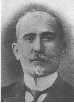
Firudin bəy Köçərli (1863-1920)