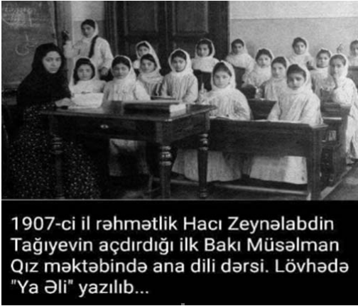
1907-ci il rəhmətlik Hacı Zeynəlabdin Tağıyevin açdığı ilk Bakı Müsəlman Qız məktəbində ana dili dərsi. Lövhədə "Ya Əli" yazılıb...

- Elə buna görə maariflənmə şərtidir, - deyə Hacı davam etdi. Millətin nümayəndəsi harda olursa - olsun, oxumağa, təhsilə düşünlülmüş rəğbət yaratmaq və yol açmaq lazımdı. Millətin nümayəndəsi nə qədər uzaqda olsa da, fərq etməz. Gərək təhsil alması