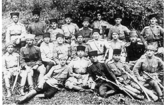
Azərbaycan milli ordu generalları və zabitləri