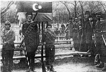
Gəncə qiyamı 25-31 may 1920

götürdülər. Bir həftə ərzində Cavad bəy Şıxlinski, Məmməd Mirzə Qacar və Cahangir bəy Kazımbəylinin başçılıq etdiyi üsyançılarla Gəncəyə daxil olmaq üçün gələn Qırmızı ordunun qalan hissəsi ilə qızgın müharibə baş verdi. Üsyanın idarə şurasında Gəncənin sayılan ağsaqqalları da iştirak edirdi. Gəncəni hər tərəfdən mühasirəyə alan ordu şəhəri top atəşinə tutmağa başladı.